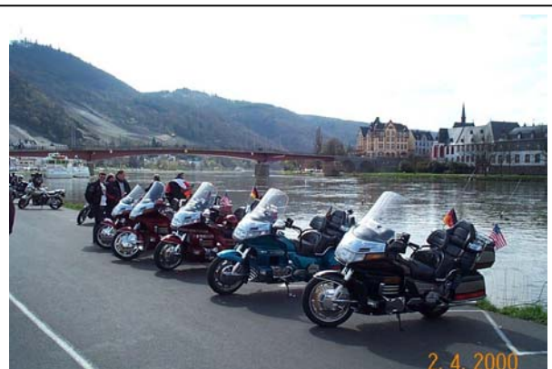
Parkplatz in Bernkastel direkt an dem Moselufer Pommes, Eis, Kaffee u. Kuchen sind nicht weit !

Zugegeben, der schönere Anblick ist von der Landseite. Durch müssen wir trotzdem. Jetzt kann man wenn es gewünscht wird auf dem großen Parkplatz eine Fotopause machen, Denn gegenüber des Parkplatzes geht es dann Bergauf nach Longkamp. Und in Longkamp auf der B 50 schöne Serpentina Bergab nach Bernkastel- Kues. Bernkastel ist für eine Pause mit einer Portion Pommes, Eis oder Kaffee und Kuchen wir dafür geschaffen.