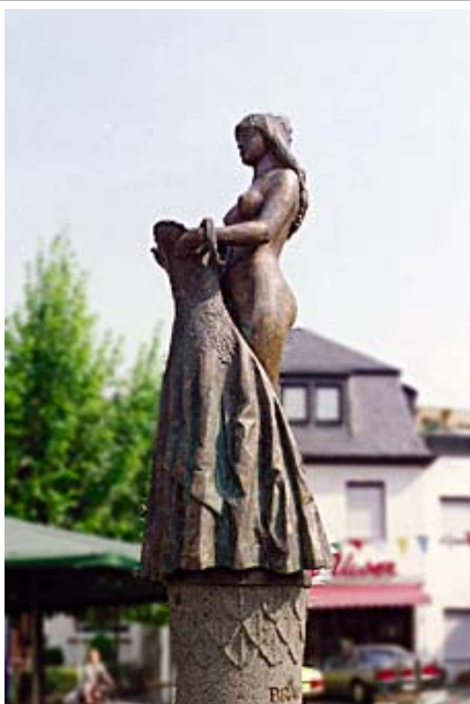
Brautrock – Brunnen in Bruttig

An Monzelfeld fahren wir vorbei, kommen auf die B 50 – dann auf die B 327 in Richtung Koblenz. Bei Kappel fahren wir dann nach Zell zur Mosel ( B 421 ). Zell bis Bullay ist in Flußrichtung. In Bullay kommen wir an diesem schönen Brunnen vorbei.