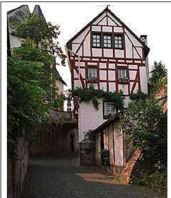
Kreisstraße Cochem –Ediger in Ediger

Bergab geht es nun wahlweise nach Sehnals, Ediger oder Eller . Ich empfehle Ediger .