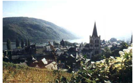
Bacharach am Rhein

An der B 9 angekommen fahren wir nach rechts in Richtung Bingen, aber nur bis wir die Pfalz im Rhein sehen. Wer hier kein Foto machen will, ist selber schuld oder hat schon eins. Nach diesem kleinen Fotostop (Die Raucher danken es einem) fahren wir weiter bis Bacharach . Einigen sicherlich von einer Kegeltour noch bekannt und unvergessen: Mit der dicken GoldWing durch die engen Gassen von Bacharach in Richtung Rheinböllen. Ein Stück der Rheingoldstraße – vorbei am Forsthaus Erbach – nach