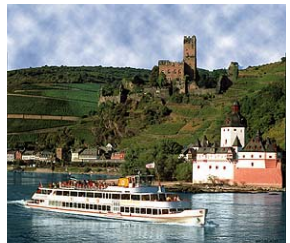
Pfalz bei Kaub und Burg Gutenfels