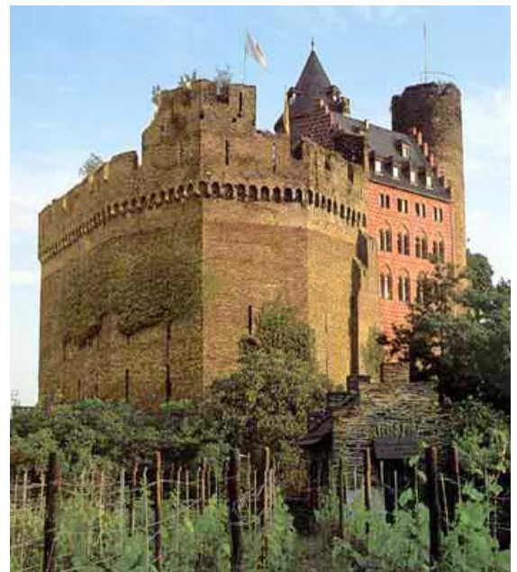
Schönburg – Mantelmauer – Landseite Bei Oberwesel am Rhein

Rheinböllen. In Rheinböllen gibt es den bekannten Trucker-Rasthof neben der A 61 mit den Mittagsportionen auf Tellern so groß wie LKW-Radkappen. Tanken kann man hier auch. Auf der Straße Rheinböllen – Stromberg bleiben wir bis Stromberg. In Strombergs Ortsmitte gibt es einen kleinen Platz mit Brunnen (hier teilt sich die Straße wegen der Enge in zwei Einbahnstraßen) und ein Eiscafé an dem ich schon öfter gehalten habe. Von diesem Platz aus starten wir dann in Richtung Simmern und fahren durch die Hunsrückdörfer Dörrebach und Mutterschied. In der Kreisstadt Simmern steuern