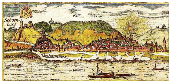
Schönburg = oberhalb von Oberwesel

Dann fahren wir weiter auf der Hauptstraße bis hinunter ins Gründelbachtal. Und, wie es so im Hunsrück ist, mal geht es runter mal geht es rauf. Jetzt geht es wider rauf. Das Gründelbachtal ist eng, die Straße schmal, aber schön. Oben in Hungenroth angekommen, unter der A 61 durch, biegen wir nach links in Richtung Norath + Pfalzfeld ab. Die Orte Norath, Pfalzfeld durchfahren wir und kommen dann nach Laudert, unter der A 61 durch, bei Wiebelsheim rechts nach Perscheid abbiegen. Der Straße folgen bis Dellhofen. Hier hinter Dellhofen kommt man zur Schönburg . Hier kann kostenlos geparkt werden, ein tolles Eis gibt es im Café - Restaurant und einen tollen Blick auf den Rhein. Danach zurück zur Straße und hinunter zum Rhein.