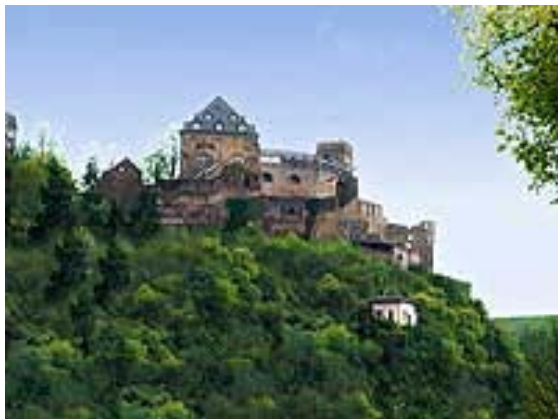
Burgruine Rheinfels + Café - Restaurant

Wir fahren durch Emmelshausen in Richtung St. Goar am Rhein. Rein fallen wir nicht, auch wenn unsere heutige Route teilweise am Ufer entlang führt. In Werlau, oberhalb von St. Goar am Ortsausgang, befindet sich rechts neben der Straße das Werlauer Freibad. Hier sollte man mal für eine Fotopause von ca. 10 Minuten die Motorräder abstellen, 100 Meter Zufuß gehen, und die Burgruine Rheinfels von oben betrachten.