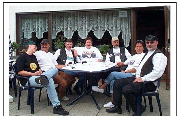
Der harte Kern – gemeinsam fahren ist schöner !