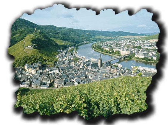
Berncastel - Kues an der Mosel